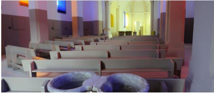
Le chœur la nef et les vitraux de l'église

L'éclairage par des vitraux en lamelles de verre teinté ainsi que les dégradés des couleurs mettront en valeur l'ensemble.